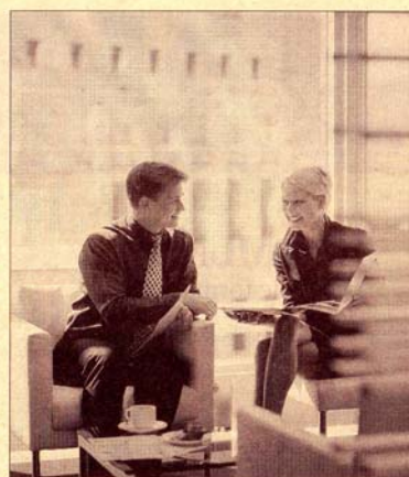
Algunas escuelas usan técnicas propias de las empresas contratadas.