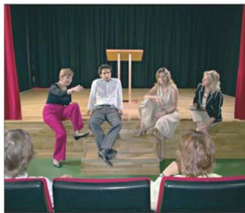
Uno de los cursos de la escuela ExpresArte, de técnicas de expresión oral.

En ExpresArte, los cursos eminentemente prácticos cuentan con un máximo de seis personas y la