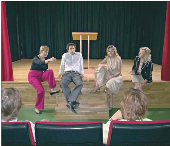
Uno de los cursos de la escuela ExpresArte, de técnicas de expresión oral.

En ExpresArte, los cursos eminentemente prácticos cuentan con un máximo de seis personas y la