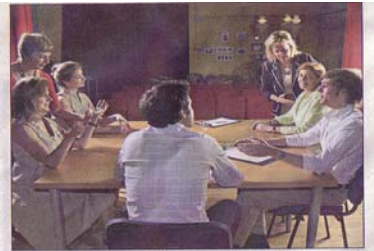
Momento de uno de los módulos para ejecutivos de ExpresArte.

Además de este módulo, ExpresArte ofrece otros cursos. 'Comunicarte' desarrolla las capacidades de expresión y comunicación en público de altos ejecutivos; 'Coaching', en sesiones individuales; 'Elocuencia' para mandos intermedios y 'Eventos'.