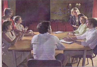
Momento de uno de los módulos para ejecutivos de ExpresArte.

Además de este módulo, ExpresArte ofrece otros cursos. 'Comunicarte' desarrolla las capacidades de expresión y comunicación en público de altos ejecutivos; 'Coaching', en sesiones individuales; 'Elocuencia' para mandos intermedios y 'Eventos'.